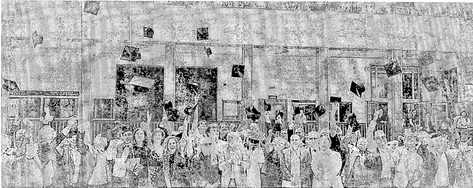
25 giugno 2018. Napoli, Aula magna Università Parthenope, Cerimonia di proclamazione dei 100 funzionari e dirigenti di Comuni italiani che hanno conseguito la qualificazione post-laurea in Project Management della PA (1° edizione).